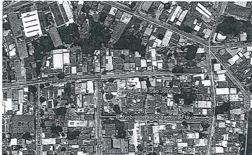
Figura 01: Localização do Hospital Municipal Dr. Ricardo Augusto de Azeredo Vianna.