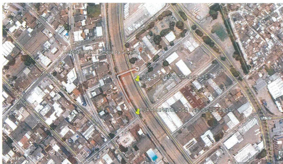
Figura 01: Imagem área da Passarela

O presente memorial tem por finalidade apresentar as diretrizes para contratação de mão de obra especializada para execução de serviços, conforme “Projeto Básico para reforma passarela hospital infantil”.